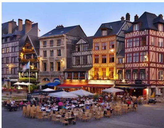
Rouen : maisons à colombages