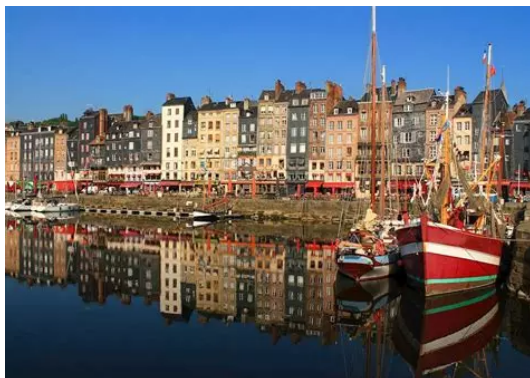
Honfleur : le port