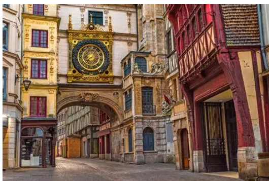
Rouen : gros horloge